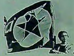
SULUOVA'DA TABAN FİYATLARINI, PAHALILIGI VE FAŞİZMİ PROTESTO MİTINGİ